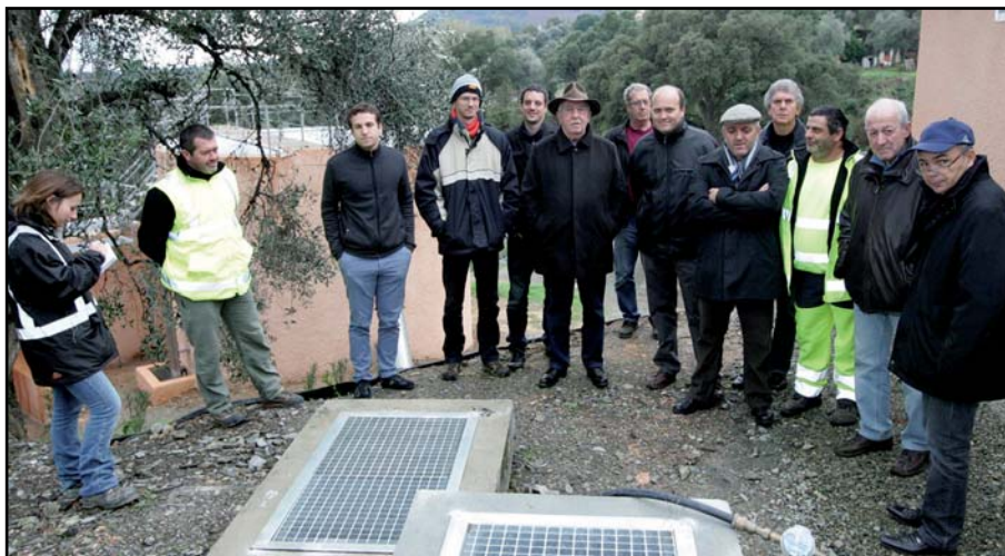
Elus et artisans réunis pour la mise en marche officielle de la station

Parce que la Communauté de Commune de la Costa Verde a choisi d'agir pour le respect de la nature, et parce qu'elle a hérité depuis le mois de juillet 2012 de la compétence «assainissement collecte et traitement des eaux usées», la station d'épuration des villages de Cervioni et Valle di Campuloru a été mise aux normes et officiellement en service. Les deux communes sont dorénavant raccordées à une unité de traitement dite «à boues activées» d'une capacité de traitement de 3000 équivalent habitants. Le bassin de vie étant de 1800 habitants, elle répond parfaitement aux besoins de la population.